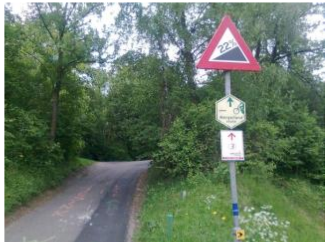
Even de benen strekken op de Keutenberg !