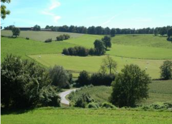
Prachtig glooiende landschappen...